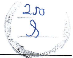
tabela de retenção em que está enquadrada, no que couber, nos termos da Lei Complementar nº 123/2006.

4.9.2 - A CONTRATADA é responsável pela correção dos dados e valores apresentados, bem como por quaisquer erros ou omissões constantes nas notas fiscais.